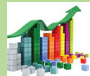
ខែមីនា ក្រុមខណ្ឌម៉ាក្រូសេដ្ឋកិច្ច និង ក្រុមខណ្ឌថវិការយៈពេលមធ្យម