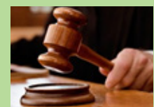
ខែវិច្ឆិកា ការអនុម័តដោយរដ្ឋសភា និងព្រឹទ្ធសភា