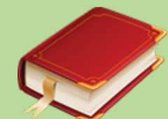
ច្បាប់ស្តីពីការទូទាត់ថវិកានៃការអនុវត្តច្បាប់ គ្រប់គ្រងហិរញ្ញវត្ថុប្រចាំឆ្នាំ