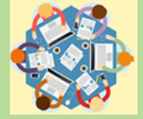
ខែសីហា ការចរចាថវិកា និងការប្តូរ សរុបថវិកា