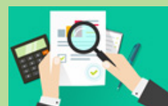
ការត្រួតពិនិត្យនៃការអនុវត្តច្បាប់គ្រប់គ្រង ហិរញ្ញវត្ថុប្រចាំឆ្នាំដោយសវនកម្មជាតិ