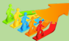
ខែមេសា សាកលវិទ្យាល័យនៃ ការរៀបចំថវិកា