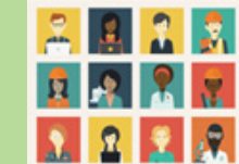
ខែមេសា-ឧសភា ក្រសួងនីមួយៗរៀបចំផែនការ យុទ្ធសាស្ត្រថវិការបស់ខ្លួន